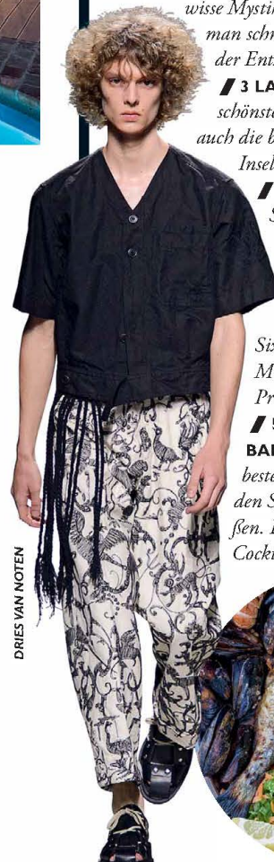
DRIES VAN NOTEN

5 THEA RESTAURANT & BAR Die Dachterrasse ist der beste Spot, um ganz entspannt den Sonnenuntergang zu genießen. Die griechischen Weine und Cocktails sind sehr zu empfehlen.